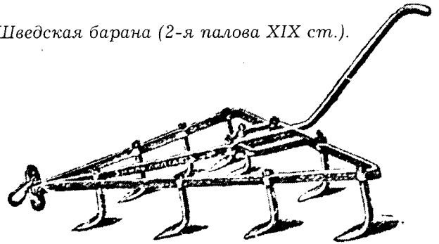
Шведская барана (2-я палова XIX ст.).