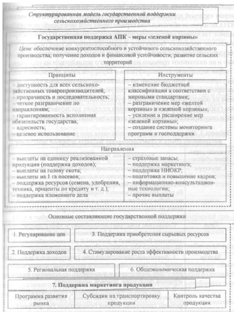
Рис. 4. Структурированная модель государственной поддержки сельскохозяйственного производства