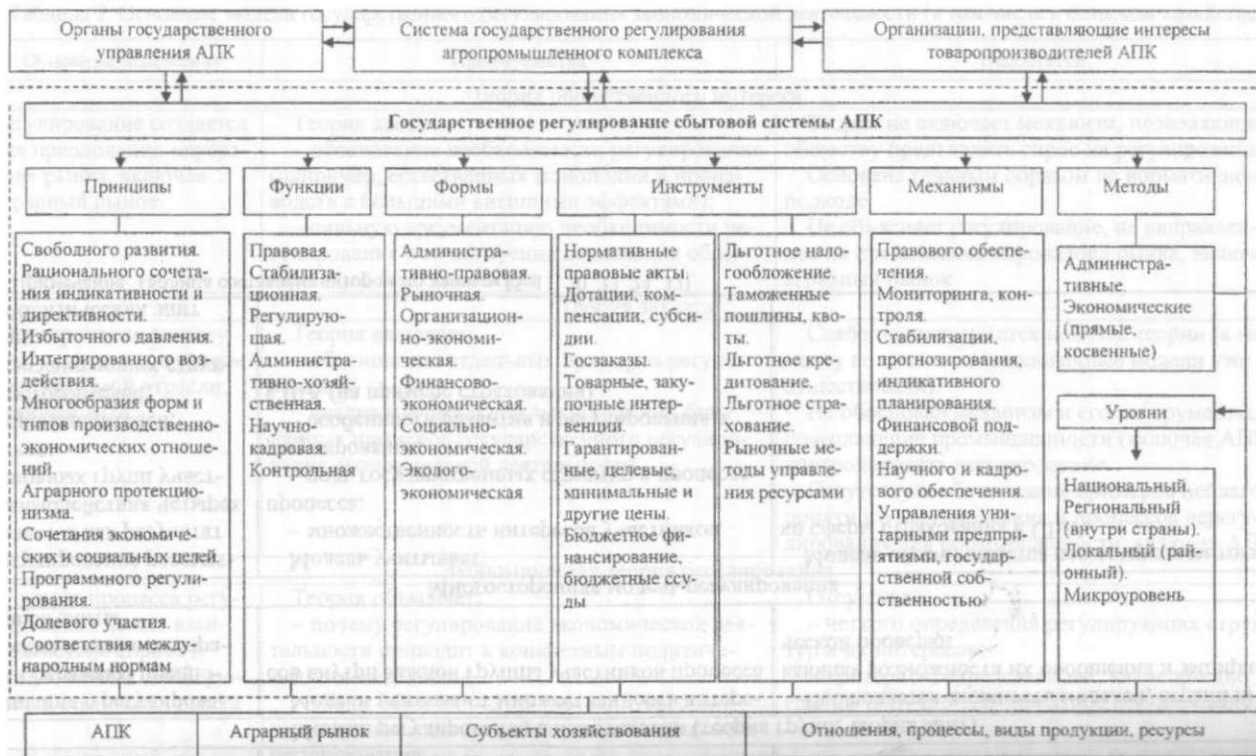
Рис. 1. Методологические основы государственного регулирования сбытовой системы АПК

Примечание. Рисунки 1-5 выполнены автором на основе собственных исследований.