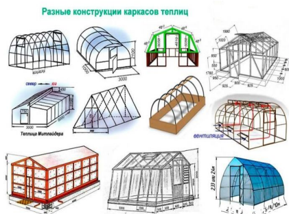
Рисунок – 3 Конструкции теплиц

Поскольку человек научился анализировать и брать у природы ее закономерности, то и при создании техники это тоже присуще. Дизайн, форма деталей, принципы работы механизмов, амортизация, обтекаемость все это человек когда-то заметил в природе, которая оказывает влияние на все технические сферы. Сегодня это очень востребовано. Природные открытия применяются в строительстве, архитектуре, медицине, в технической промышленности. Человек должен лишь умело владеть знаниями, чтобы воплотить в технике все подсказки природы и раскрыть ее тайны. Одним из примеров использования оптимальных форм природы в сельском хозяйстве является теплица (рисунок 3).