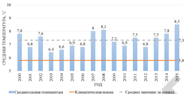
Рис. 1. Среднегодовая температура воздуха в Республике Беларусь (норма 5,8 °C)

личить количество продукции с единицы площади, снизить её себестоимость и повысить качество.