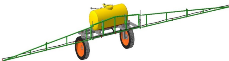
Рисунок 3 – 3D модель малообъемного опрыскивателя в сборе

На основании банка данных библиотеки деталей и узлов методами компьютерного 3D моделирования выполнена 3D модель малообъемного опрыскивателя с основными рабочими органами в сборе (рис. 3).