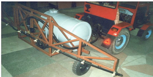
Рисунок 1 – Малообъемный штанговый опрыскиватель

Разработан и предлагается экспериментальный образец малообъемного штангового опрыскивателя для химической защита растений в том числе и посадок картофеля (рис. 1). Опрыскиватель состоит из рамы с прицепным устройством. На раме крепится емкость с заправочным устройством и фильтром.