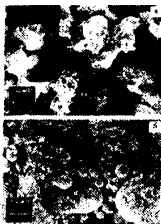
Рис. 1 – Форма частиц ферроабразивных порошков, полученных при распылении водой сплавов: а – ФТ-2; б – С-300