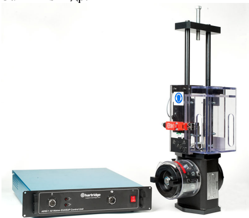
Рисунок 3 – Комплект «НК-1400», «Hartridge Ltd», United Kingdom

Основное преимущество – это модульность и возможность достаточно быстрого монтажа-демонтажа на стенд заказчика. Один из недостатков – это отсутствие способности анализировать быстродействия золотника по технологии BOSCH (BIP) и скорость и величину создания внутреннего давления в компоненте DELPHI (LOAD CELL).