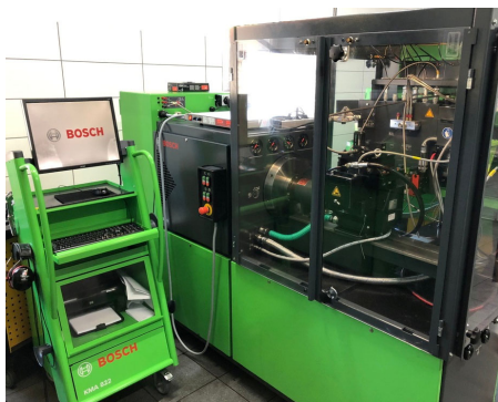
Рисунок 2 – Стенд «EPS-815» Robert Bosch GmbH

Стенд позволяет проверять электромагнитные компоненты на всех режимах, имитируя эксплуатацию в двигателях, учитывая полученные технические данные и сравнивая результаты тестирования с заводскими характеристиками [6]. Регулирование в технике происходит с учётом скорости посадки золотника VIP. Это параметр является наиважнейшим контролируемым параметром при проверке на стенде. Особенности данной функции (VIP-регулирование) на сегодняшний день доступны у производителя данного стенда, и ознакомиться с этой функцией можно на обучающих курсах в Академии BOSCH, Москва.