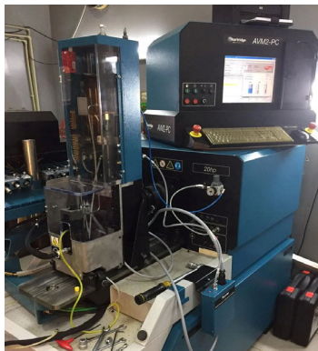
Рисунок 1 – Стенд AVM2-PC с камбоксом и системой управления НК-1500 («Hartridge Ltd», United Kingdom)

TIME. Также на стенде реализована функция формирования кодов, для 4-х контактных насос форсунок и электроуправляемых насосных секций, в зависимости от полученных результатов по измерению параметров производительности и внутреннего давления [5].