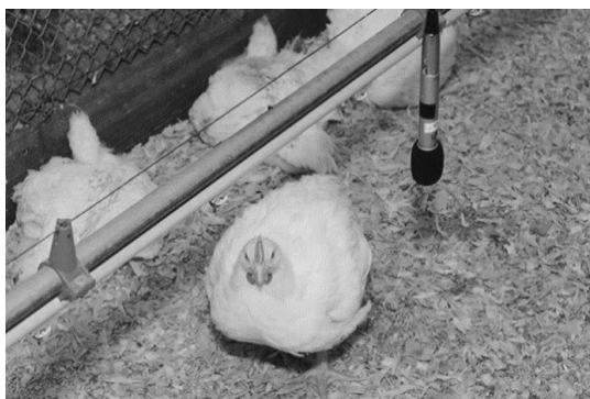
Рисунок 2 Аудиосистема для наблюдения за состоянием птицы

Также разработана система для оценки состояния и благополучия цыплят-бройлеров с помощью аудио (рисунок 2). Используя аудиосигналы, захваченные в птичниках, можно обнаруживать такие заболевания, как ларинготрахеит, инфекционный бронхит, а также отслеживать реакцию птицы на стресс из-за температуры и концентрации аммиака, с помощью цифровой обработки сигналов, ИИ и методов машинного обучения.