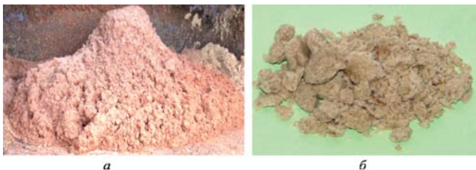
Рис. 2. Мезга картофельная: а – отцентрифугированная СВ=25 %; б – отпрессованная СВ = 39,89 %

Таким образом, трехэтапное механическое обезвоживание (отстаивание, центрифугирование и прессование) позволяет получать отпрессованную мезгу с массовой долей сухих веществ до 40 % и с содержанием в мезге до 5,6 % влаги от всего ее количества, содержащегося в исходной жидкой мезге [5–7, 10].