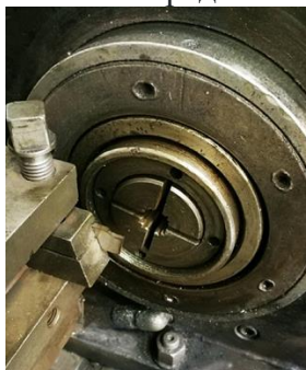
Рисунок 1 – Фотография рабочей зоны при разрезке труб резцами.

При заточке отрезных резцов алмазными кругами необходимо учитывать характерную особенность процесса шлифования этим инструментом, состоящим в быстрой потере его режущей способности в результате интенсивного изменения рельефа режущей поверхности и её свойств [5]. Для обеспечения высокой эффективности алмазного шлифования необходимо производить периодическую правку и восстанавливать режущую способность кругов, поскольку возникает засаливание рабочей поверхности круга, что приводит к перерасходу заточных инструментов. Причина такого положения состоит в отсутствии связей с высокими смазочными свойствами и, как следствие, потеря ими режущих свойств из-за засаливания. Одним из перспективных способов заточки режущих инструментов может быть магнитно-абразивная обработка (МАО) [6]. При МАО режущим инструментом является ферроабразивный порошок (ФАП) и смазочно-охлаждающие технологические средства (СОТС), которые находятся в рабочем зазоре в подвижно скоординированном состоянии. Роль связки между ферроабразивными зёрнами выполняет магнитное поле (МП), генерирующее упругие силы воздействия на зёрна ФАП. Экспериментальные исследования проводили при МАО резцов, которые предназначены для отрезки тонкостенных труб при производстве глушителя звука грузового автомобиля (рисунок 1). Качество заточки резца определяется в основном условным радиусом скругления режущей кромки и шероховатостью передней и задней поверхностей.