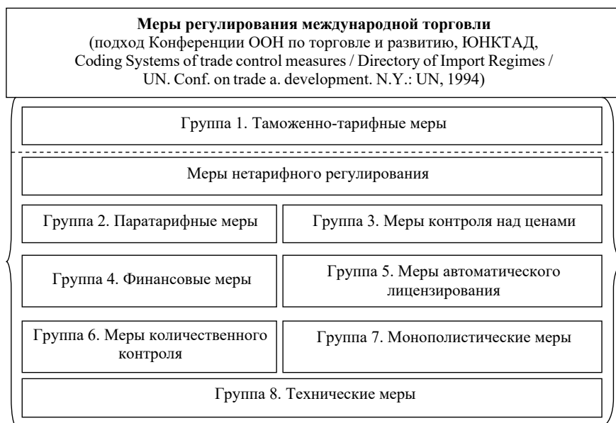
Рис. 2. Меры регулирования международной торговли (подход Конференции ООН по торговле и развитию, 1994 г.) (выполнен автором по данным https://unctad.org )

После выхода Справочника по импортным режимам, подготовленного Секретариатом ЮНКТАД ( Directory of Import Regimes / UN. Conf. on trade a. development. N.Y.: UN, 1994 ), перечень нетарифных мер стал пополняться из ежегодно публикуемых ВТО обзоров мировой торговли. Важным эмпирическим источником являются также обзоры торговой политики, которые готовятся на национальном уровне отдельными государствами, а также официальная информация о разрешении в рамках ВТО различного рода конфликтов и споров по применению нетарифных мер (НТМ).