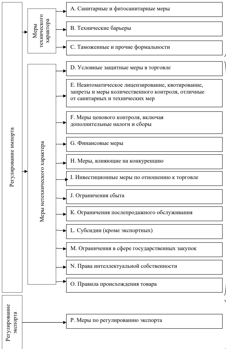
Рис. 3. Классификация нетарифных мер регулирования внешней торговли ЮНКТАД, 2008 г. (с изменениями 2009 и 2012 гг.) (выполнен автором по данным https://unctad.org )