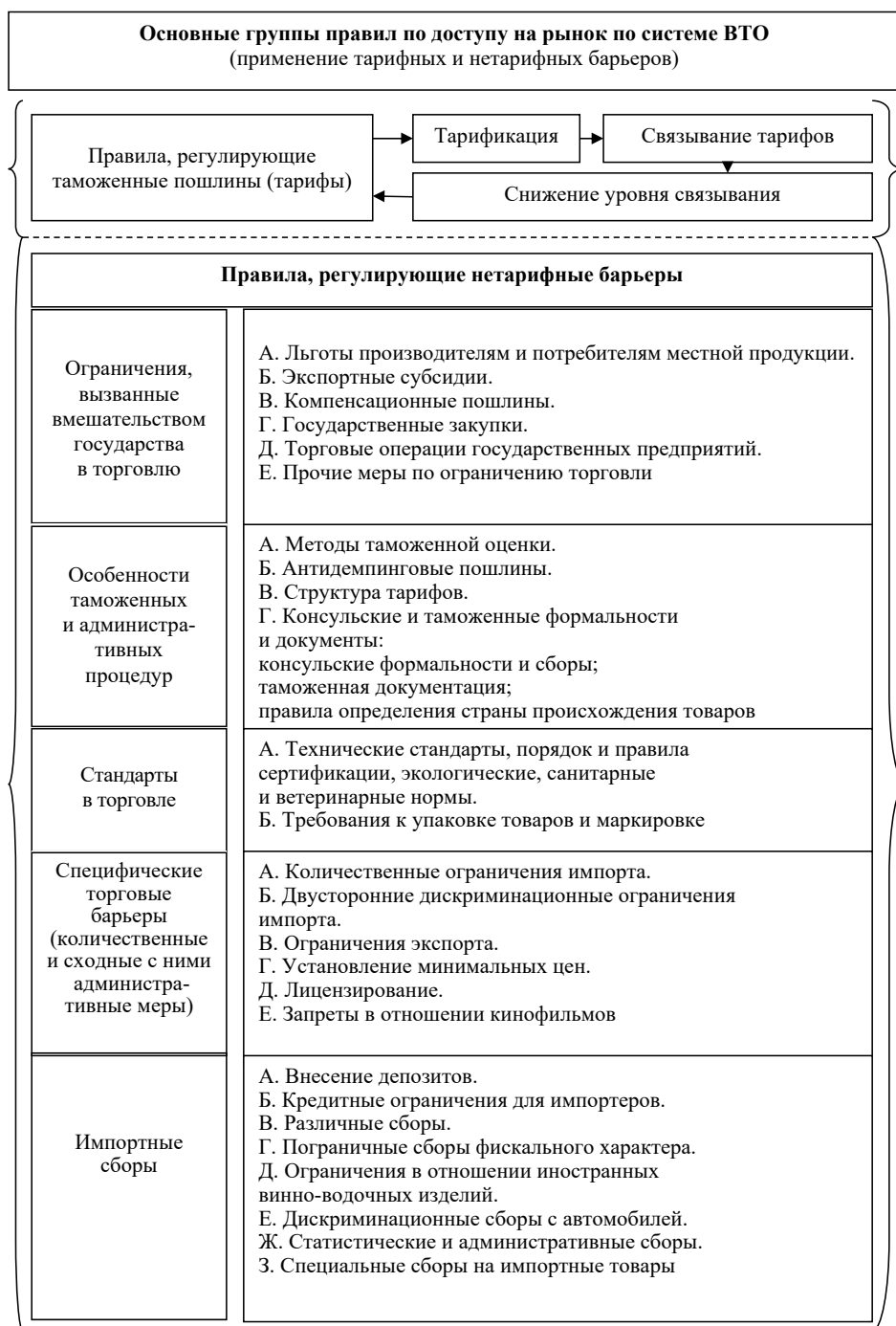
Рис. 1. Основные группы правил по доступу на рынок по системе ВТО (выполнен автором по данным http://www.vavt.ru/wto/wto )