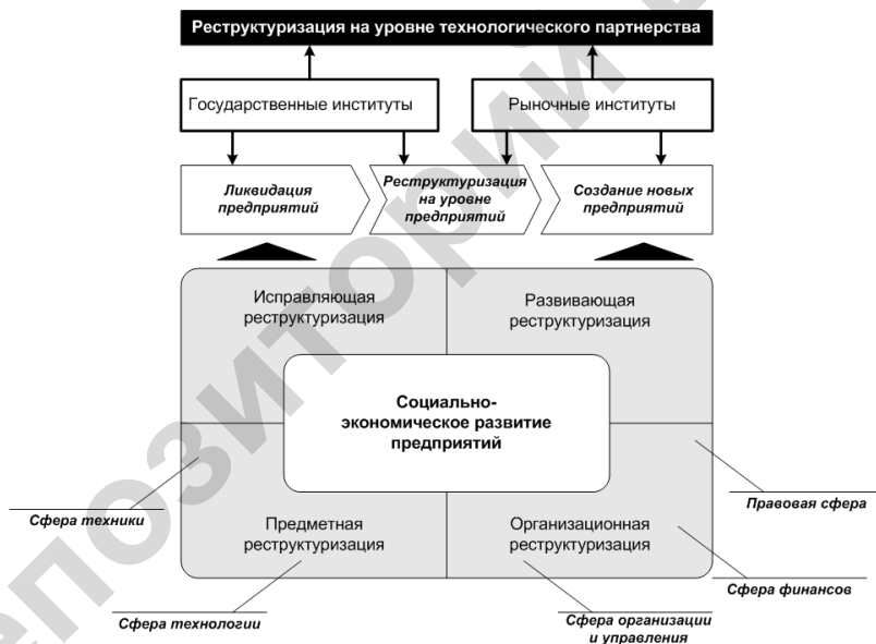
Рисунок 1 – Процедурное содержание реструктуризации

Реструктуризация льноперерабатывающих предприятий – процесс комплексной адаптации производительных сил к закономерностям функционирования рыночной экономики, проявляющийся в реструктуризации на уровне технологического партнерства в соответствии с возможной процедурой перелива ресурсов с целью повышения эффективности выпуска конечной продукции. Процедурное содержание реструктуризации льноперерабатывающих предприятий отражено на рисунке 1.