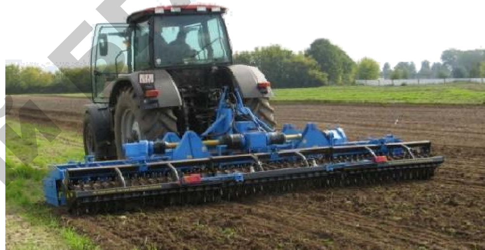
Рисунок А.3 – Агрегат комбинированный почвообрабатывающий АКП-6