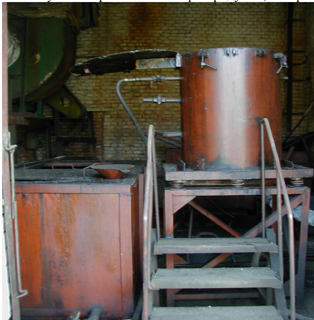
Рисунок 1 – Установка для приготовления эмульсии

переработки и утилизации нефтесодержащих отходов и отработавших водных растворов ТМС. Часто предприятия с целью утилизации отработавших нефтесодержащих продуктов сжигают их с использованием специальных установок. При этом на утилизацию тратится топливо. Кроме того, на наш взгляд, не рационально используются отработавшие нефтепродукты, которые могут быть источником получения дохода.